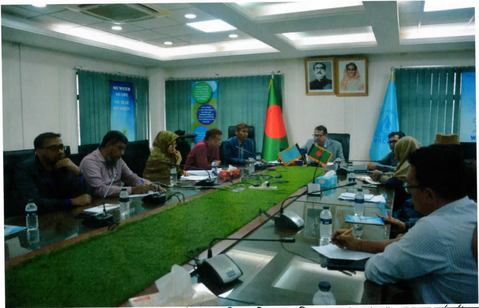
কর্মসম্পাদন সূচক ২.৪.১ এর অধীন বিগত ০৪ মার্চ, ২০২৪ তারিখে পানি সম্পদ পরিকল্পনা সংস্থা (ওয়ারপো) এর সকল কর্মকর্তাদের অংশগ্রহণে তথ্য অধিকার আইন, বিধিমালা, ও প্রবিধানমালা বিষয়ক দিনব্যাপি প্রশিক্ষণ কর্মশালার ছবি প্রমাণকঃ ০১।